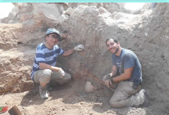
発掘調査 (アドバンス研修ツアー)